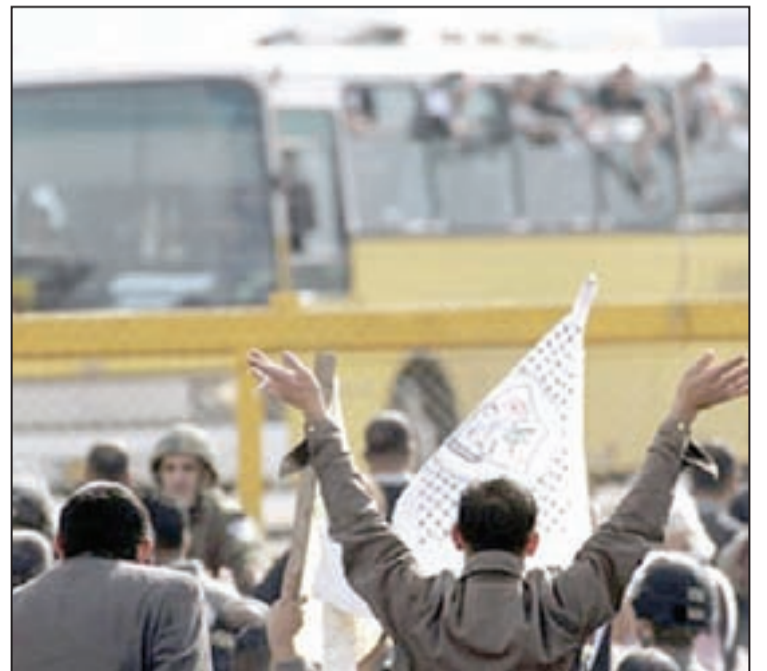
Palestinonan ta ricibi e presonan libera

Actualmente, como 10.000 palestino ta cera den prison